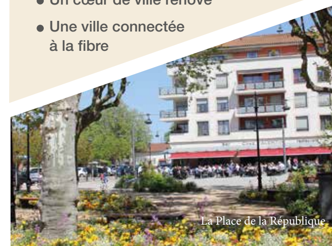
La Place de la République