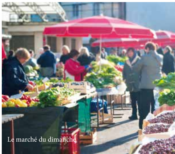
Le marché du dimanche

La résidence s'articule autour d'un jardin végétalisé en cœur d'îlot et privatif plein sud. Quelques appartements du dernier étage en attique bénéficieront d'une vue exceptionnelle dégagée qui offrira calme et sérénité à leurs occupants.