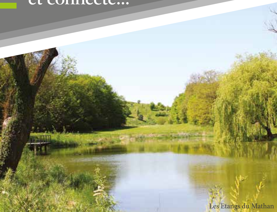
Les Etangs du Mathan