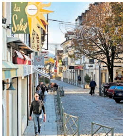
Ferney-Voltaire et ses commerces