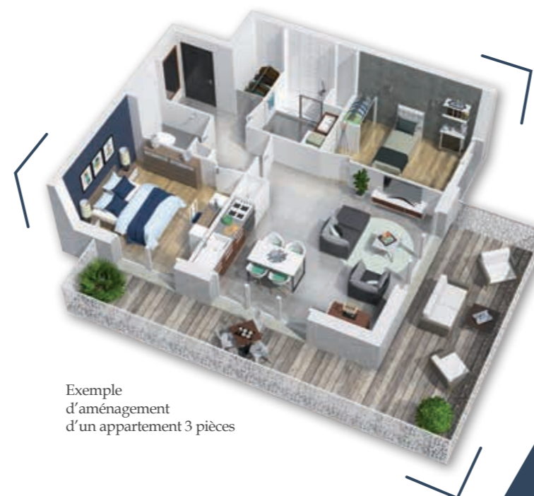
Exemple d'aménagement d'un appartement 3 pièces

La passerelle Nelson-Mandela à Décines-Charpieu